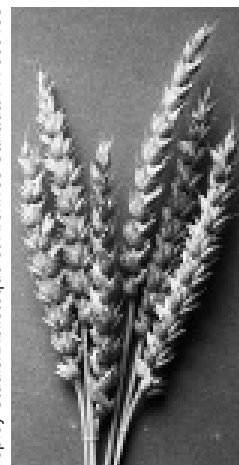
'Marquis' par Charles Saunders