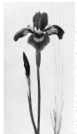
'Pickanock' par Isabella Preston