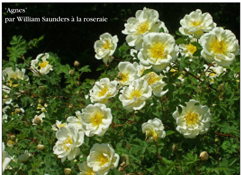
'Agnes' par William Saunders à la roseraie